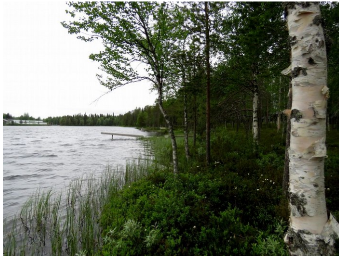
Kuva 1. Eteläinen rantavyöhyke kuvattu länteen. Huuhtoutunutta karkeaa kivikkoa, joka on soistunut, rehevä kasvillisuus.