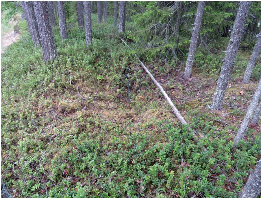
Keskimäinen kuoppa kuvattu pohjoiseen.

Kuvaus: Kapealla hiekkaharjanteella on kolme kuoppaa, suurin näistä on halkaisijaltaan 3 m ja 60 cm syvä. Kaikissa kuopissa on ohuen humuskerroksen alla puhdas hiekka, suurimmassa kuopassa puhdas hiekkakerros todettiin pohjasta vielä 50 cm alaspäin. Kuopat ovat resenttejä, ilmeisesti maanottokuoppia.