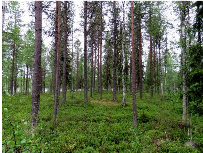
Kuva 2. Matala kivinen harjanne eteläosassa, kuvattu itään, varttunutta kasvatusmetsikköä.