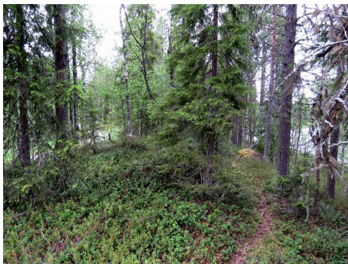
Kuva 3. Kapea hiekkaharjanne alueen koillisreunalla. Rantavyöhyke on soistunut. Varttunutta kasvatusmetsikköä.