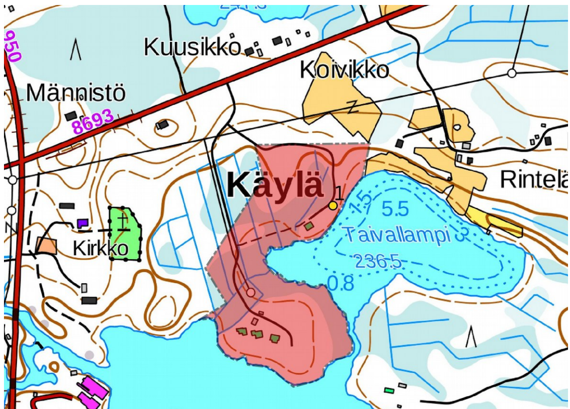
Kartta 2 Yleiskartta; muu havainto 1 (keltainen piste) Kaava-alue punaisena. Maanmittauslaitoksen peruskarttarasteri 1:20 000, 6/2016.