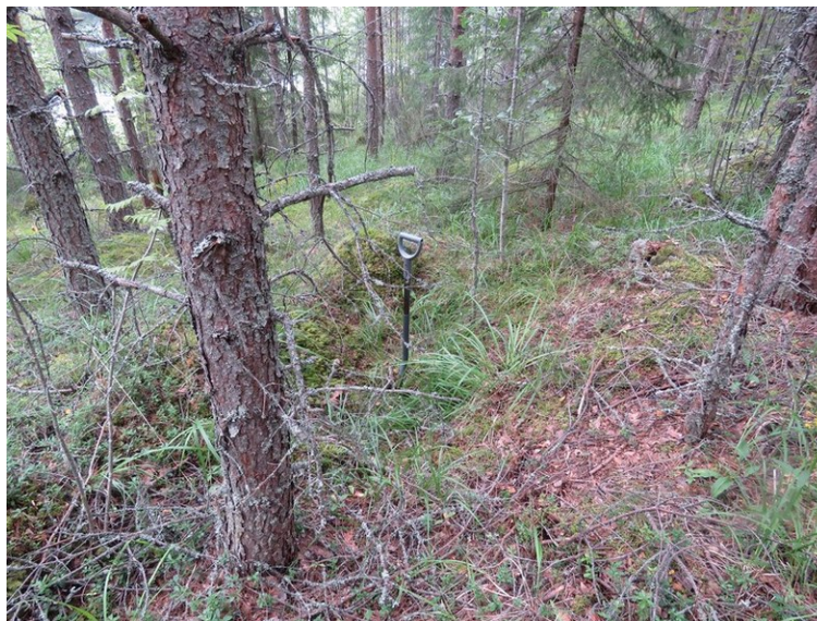
Kohteen länsipuolella oleva kuoppa kuvattu koilliseen.

Lisäselvitys 2016: Koekuoppien perusteella rakenne on resentti. Ohuen humuskerroksen alta löytyi puhdasta moreenimaata. Noin 20 m kohteen länsipuolella on kuoppa, jossa on nokimaata pohjassa, reunojen alla havaittiin sekoittunutta maata ohuen humuskerroksen alla.