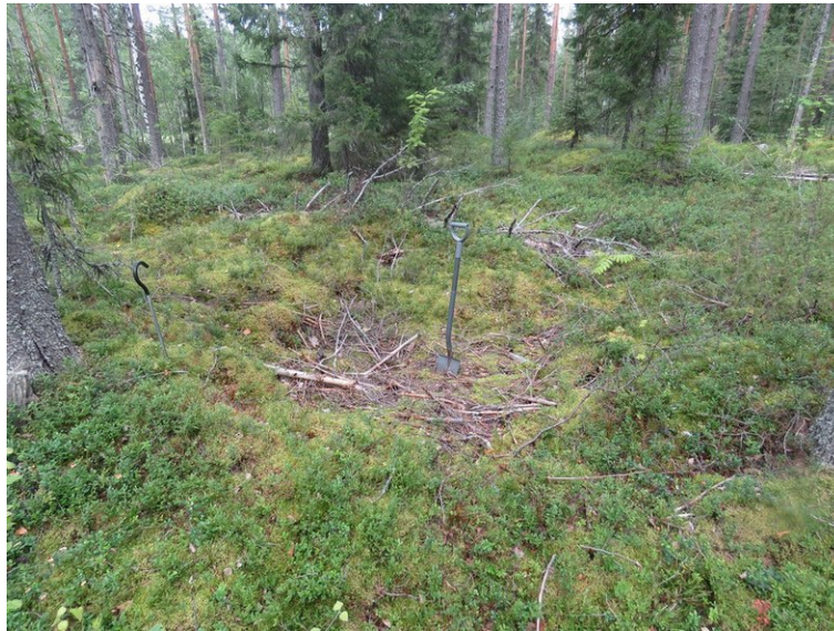
Asumuspainanteeksi tulkittu kuoppa (inv. 2013) kuvattu luoteeseen.