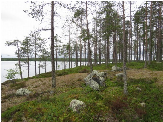
Kuva 4. Kortteli 11, pohjoisosa kuvattu pohjoiseen. Pääosin kalliota.