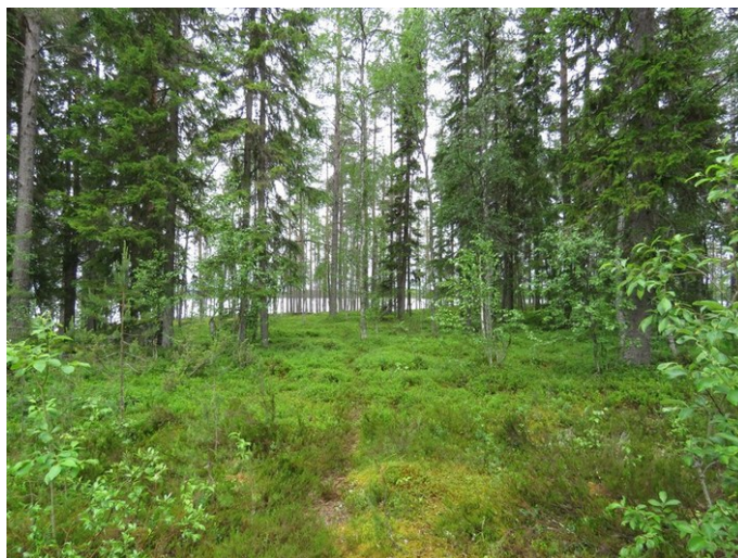
Kuva 5. Kortteli 11, eteläosa kuvattu luoteeseen. Tasainen kivikoinen alue, varttunutta kasvatusmetsikköä.