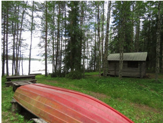
Kuva 3. Kortteli 9, rantavyöhyke kuvattu lounaaseen. Itäosa rakennettu ja tasoitettu, länsiosassa loiva kivinen rinne, tuoreehko kangas.