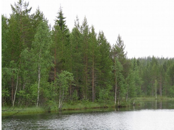
Kuva 1. Kortteli 6, rantavyöhyke kuvattu etelään. Huuhtoutunutta karkeaa kivikkoa, joka on soistunut, rehevä kasvillisuus.

Esiselvityksessä arvioitiin lähiseudulla aikaisemmin tehtyjen arkeologisten selvitysten tulokset. Lisäksi käytettiin GTK:n kallio- ja maaperäkartoja, Maanmittauslaitoksen ortoilmakuvia, korkeusmallia sekä laserkeilausaineiston pistepilviaineistoa. Maastoinventointi perustui pääosin pintahavainnointiin, koekuoppia tehtiin korttelin 9 länsiosassa lähellä rantaa ja korttelin 6 itäosassa. Alue on pääosin tasaista hyvin kivistä pohjamoreenia, rantavyöhyke on huuhtoutunutta kivikkoa, joka on soistunut. Korttelin 11 kohdalla on enimmäkseen kalliota.