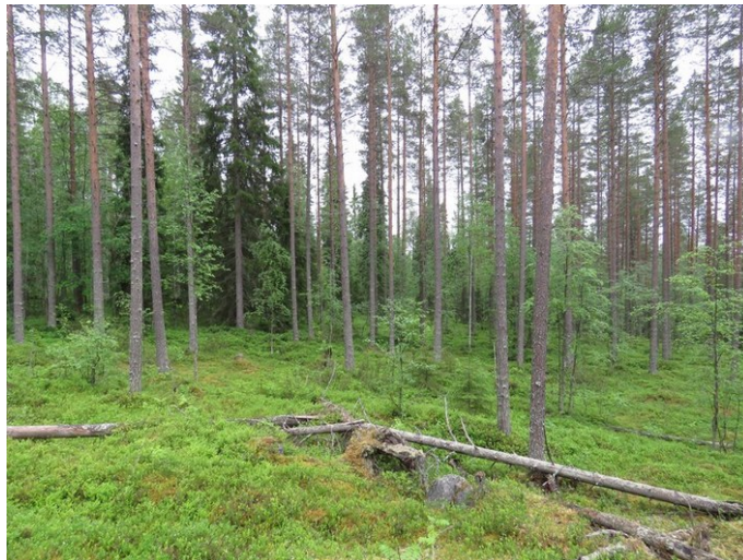
Kuva 2. Tielinjaus korttelille 6, kivinen harjanne, paikoitellen kalliota, harvennettua varttunutta kasvatusmetsikköä.